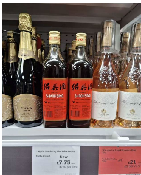
图 3. 海外货架陈列的绍兴黄酒

在国际消费场景中，绍兴黄酒的语言混用现象尤为突出，成为跨文化商业沟通的典型实践。例如海外中餐厅与品鉴场景中出现“汉语核心符号 + 目标语补充说明”的混用模式。在考察绍兴黄酒在海外消费场景中的语言混用特征，研究团队通过线上平台(如品牌官网、社交媒体)与实地调研相结合的方式，收集日本东京、法国巴黎等地黄酒相关语言景观案例。需说明的是，此类案件在本研究中作为辅助说明性例证使用，以呈现多语实践的多样性，而非纳入 171 张核心语料的系统分析。如日本《孤独的美食家》取景的神宫前中餐厅以「かめ出し紹興酒(グラス)」(坛装绍兴酒，杯装)的双语标价，保留“绍兴酒”汉字核心符号，同时标注“不加水、不加冰”的传统饮用方式(如图 4)；东京银座高端中餐厅「江南春」在菜单中以中英日三语标注“酒香醉鲍鱼(Marinated Abalone in Chinese Yellow Wine)”，将绍兴黄酒作为烹饪核心，用多语转译传递黄酒入菜的风味特征。在法国巴黎的黄酒品鉴沙龙，青瓷瓶身的“国酿 1959”汉字品牌标识与法语品鉴说明、西式品鉴杯具相结合(如图 5)，既保留黄酒的东方文化根脉，又以法语适配欧洲消费者的认知习惯，构建起东方酿造与西方礼仪结合的跨文化叙事(如图 6)。这种语言混用并非随意组合，而是兼顾文化标识性与消费实用性——汉语符号承载品牌文化记忆，目标语满足消费认知需求，既让国际消费者感知绍兴黄酒的文化独特性，又降低其理解与选择成本，进一步凸显了多语实践在跨文化商业互动中的核心作用。