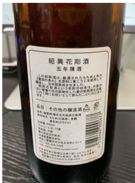
图 2. 出口日本的绍兴黄酒