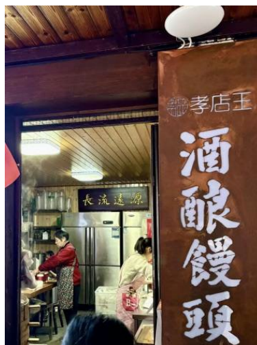
图 11. 安昌古镇酒酿馒头店铺

符号缺乏多模态辅助诠释及标准化多语解说，国际游客感知门槛高。二是标准化与文化渗透失衡，产品分级标准未转化为可视化标识，部分 IP 与衍生品缺乏黄酒文化深度渗透。三是资源碎片化，文化符号传播缺乏场景连贯性，数字化多模态工具未实现全域协同。四是受众适配不足，难以同时满足年轻群体的审美需求与不同年龄段对文化深度的诉求，全龄段文化认同尚未形成。