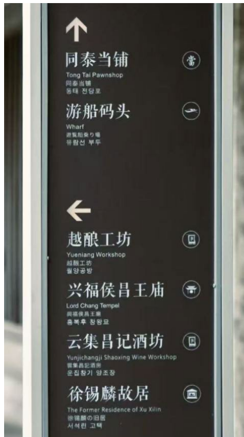
图 1. 多语标牌

信息传递需求，又通过规范译写实现地域文化的跨语境传播，彰显多语实践的商业实用性与文化传播价值。