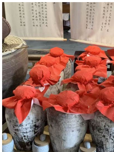
图 10. 安昌古镇非遗黄酒