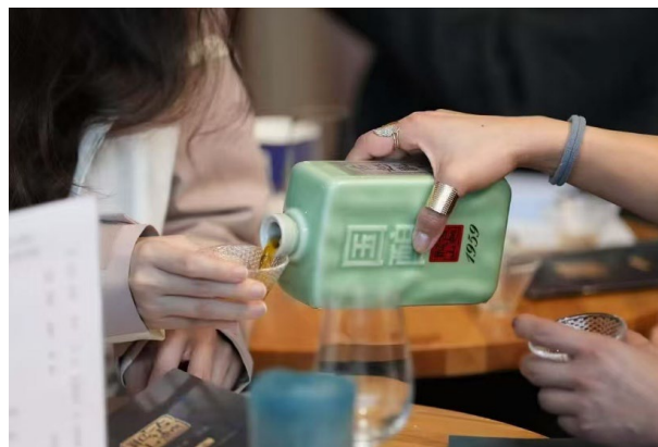
图 5. 法国巴黎的黄酒品鉴沙龙