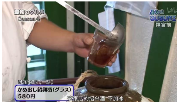
图 4. 日本《孤独的美食家》取景的神宫前中餐厅