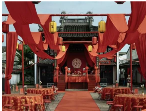
图 8. 安昌古镇民俗展演