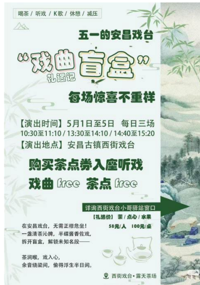
图 7. 五一的安昌戏台