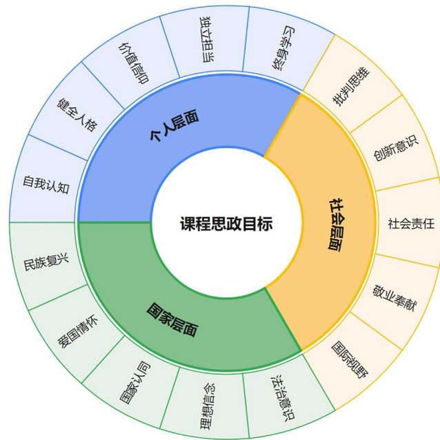
图 2. 课程“三维”思政育人目标